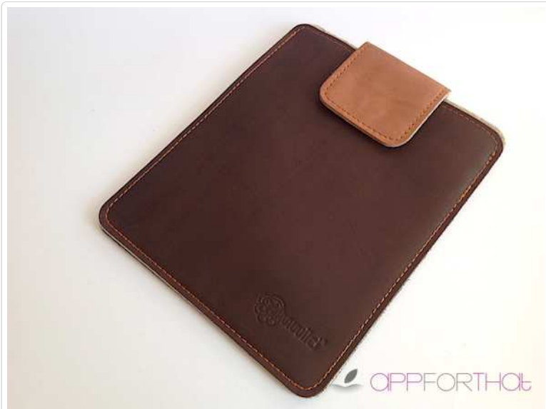
Die Almwild Ledersepp Tasche ist eine wunderbar weiche Ledertasche für euer iPad