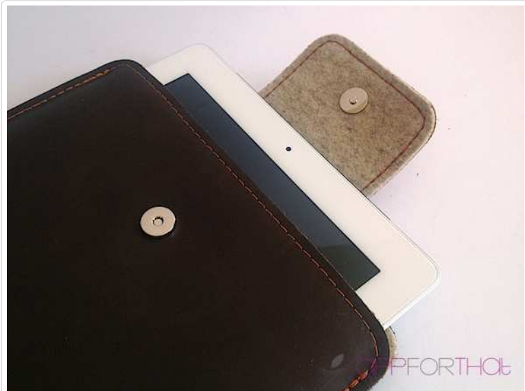
Hier geht das iPad hinein - Ledersepp mit offener Lasche