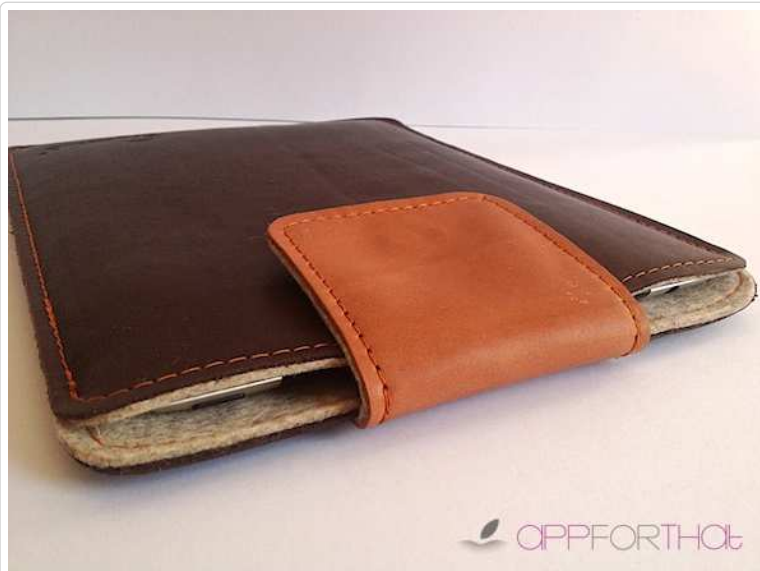
Almwild Ledersepp geschlossen (via Druckknopf Lasche) mit iPad 3