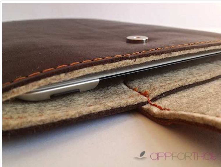
Das iPad im Ledersepp - Zu sehen die Merino-Schurwolle, die das Innere in 3mm Stärke abpolstert