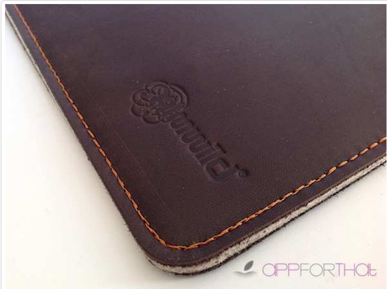
Eine dezente Prägung auf der Vorderseite